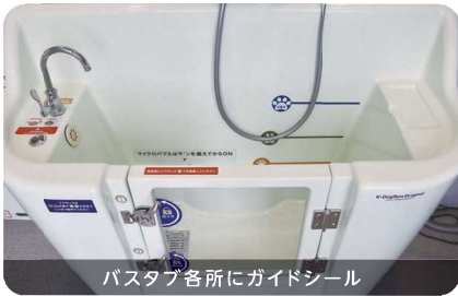
バスタブ各所にガイドシール

一般家庭でも使用される排水ボタンなどを採用し、直感的に操作できるよう配慮しました。バスタブ各所のガイドシールや誤操作防止のカバー等も用意し、初めて使う方でもストレスなくご利用いただけます。