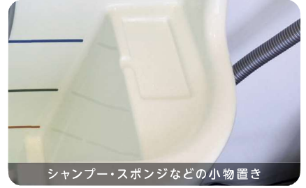
シャンプー・スポンジなどの小物置き