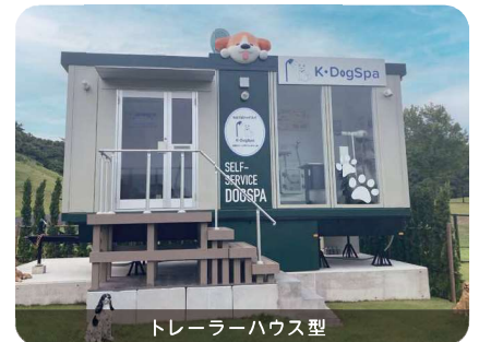
トレーラーハウス型