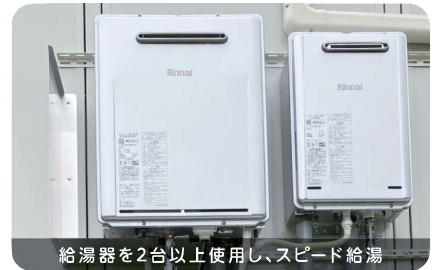
給湯器を2台以上使用し、スピード給湯

※マイクロバブル機能は当製品と、リンナイ株式会社製ガス給湯器屋外壁掛け24号エコジョーズ (RUF-UME2406SAW(A))を組み合わせて使用します。