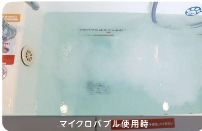
マイクロバブル使用時