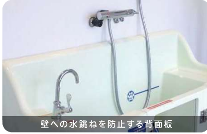
壁への水跳ねを防止する背面板