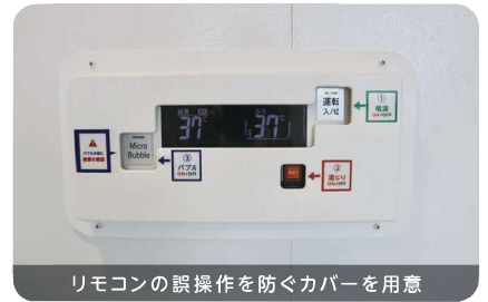
リモコンの誤操作を防ぐカバーを用意