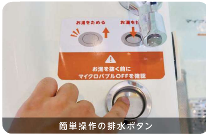
簡単操作の排水ボタン