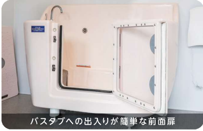
バスタブへの出入りが簡単な前面扉

店舗ご利用者の声を反映し、女性でも使用しやすいサイズ感に。大型犬が出入りしやすい前面扉や、小物置きなど、細部まで使いやすさにこだわりました。