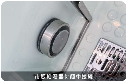
市販給湯器に簡単接続

汚れが落ちやすいと話題のマイクロバブル機能をバスタブ内に組み込むのではなく、マイクロバブル給湯器と簡単に接続できるように設計しました。これにより低コスト、メンテナンス性の高いマイクロバブルスパを実現しています。